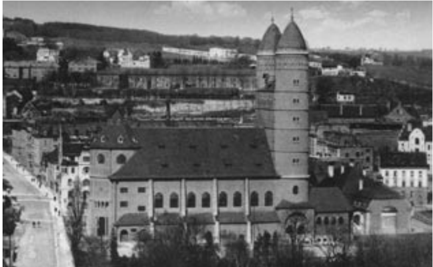
Die Pauluskirche in der Frauenstr. Ulm.