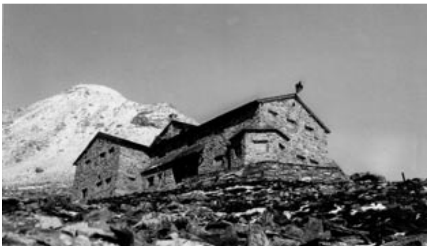
Unser Exkursionsziel: Das neu erbaute Friesenberghaus 1929. Jüdisches Museum Hohenems.

Der historische Hintergrund: In den religiösen Grundlagen des Judentums sind Berge und Felsen von großer Bedeutung. Eine ebenso große Rolle spielten die Alpen und das Bergsteigen in der bürgerlichen jüdischen Bevölkerung Mitteleuropas während des 19. und 20. Jahrhunderts. Doch die Juden wurden angefeindet als Inbegriff des „Fremden“ und ihnen wurde jede „wahre“ Heimat- und Naturverbundenheit abgesprochen. 1923, zehn Jahre bevor die Nazis an die Macht kamen, gab es schon eine