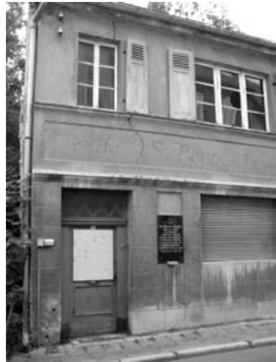
Prager Haus in Apolda, Foto: M. Dörfel

Doch die wichtige Erinnerungsarbeit des Vereins wird nicht von allen Seiten geschätzt, so wurden mehrfach die Fenster des Hauses eingeworfen und im September 2010 wurde der Gedenkort zweimal durch die Ablegung eines Schweinekopfes geschändet.