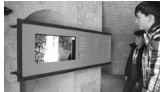
Zwei dzokkis bei der kritischen Betrachtung der Kurzfilme, April 2011. A-DZOK. Foto: Gerhard Braun

Wer dann nach dem Ausstellungsbesuch Lesestoff mit nach Hause nehmen möchte, findet unsere Publikationen in der neuen Buchvitrine am Leseraum ausgestellt und ist herzlich eingeladen, aktuelle Infos aus dem Flyerregal im Ein-/Ausgangsbereich mitzunehmen. Dort findet sich zum Preis von einem Euro auch unser neuer englischsprachiger Kurzführer, der von ausländischen Besuchern, Studenten oder Wissenschaftlern immer wieder angefragt worden war, und der jetzt auf 24 Seiten im DIN-lang Format kurz und bündig über das ehemalige KZ Oberer Kuhberg Auskunft gibt.